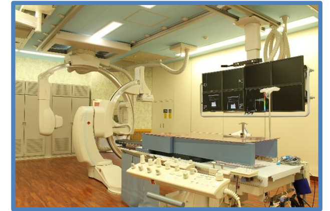
心臓カテーテル検査室

患者様には通常2泊3日のご入院をしていただく検査となります。さらに心臓カテーテル治療（PCI）も可能ですが3泊4日の入院となります。