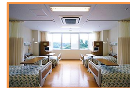
4人部屋 室料 : 無料

回復室は、手術や処置等の頻繁な観察を必要とする患者様に入室いただいております。4階病棟と5階病棟に6床ずつあり、当院看護スタッフによる手厚い看護をさせていただきます。