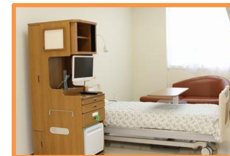
個室(5階病棟) 室料 : 7,560円(税込)

次に、準個室です。5階病棟に2部屋ございます。作りは、4人部屋と変わりありませんが、特徴としてはテレビ・冷蔵庫の無料化と準個室だけに設置しております専用のタンスがございます。コート等を掛けるには十分なスペースがあり、入院時の荷物をしまっておくのに最適です。また、隣の患者様との隔てる仕切りも丈夫なパーティションを使用しており、患者様へのプライバシーに配慮しております。