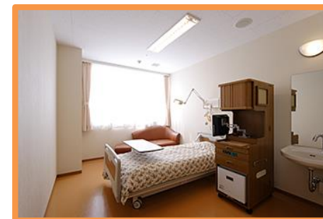
個室(4階病棟) 室料 : 9,180円(税込)

4階個室には、トイレ・洗面台・シャワー室が完備されており、快適な入院生活をサポートさせていただいております。5階個室には、トイレ・洗面台・シャワーはございませんが、17㎡の広さを確保しており患者様だけではなく、ご家族の方も快適にお過ごしいただけます。