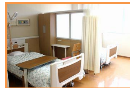
準個室 室料 : 2,160円(税込)