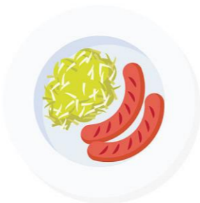
sausages and sauerkraut